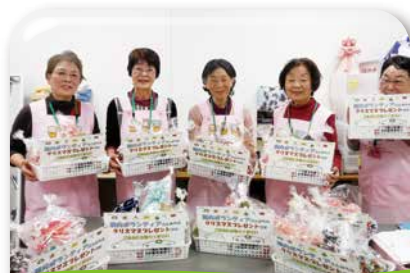
クリスマスプレゼント作り

巾着袋やティッシュケース、折り紙で作った人形など、手作りのクリスマスプレゼントを入院患者さんへ作っていただきました。